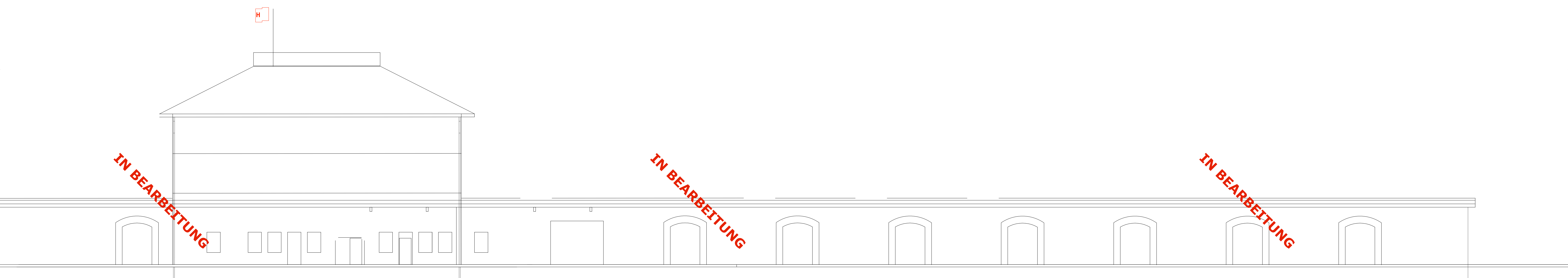
ANSICHT NORDWEST 1 : 100

Unterschrift: Eigentümer: Bauherrschaft / Bauleitung: Objektadresse: Bauherrschaft / Bauleitung: Architekt: